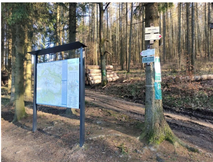
Ukázková realizace v okolí města Šluknov